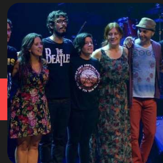
Ná Ozzetti e Zeca Baleiro